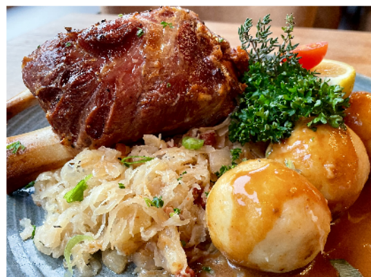
Pork knuckle (delicately pink inlaid) with sauerkraut and dumplings