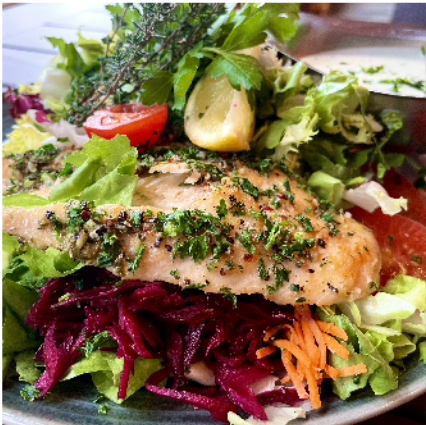
Salat mit Hähnchenbrust