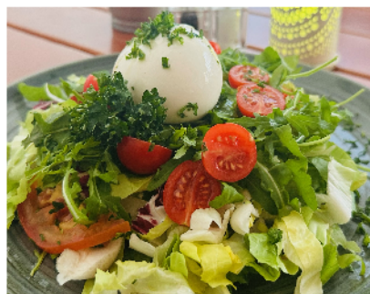
Tomato/buratta arugula salad