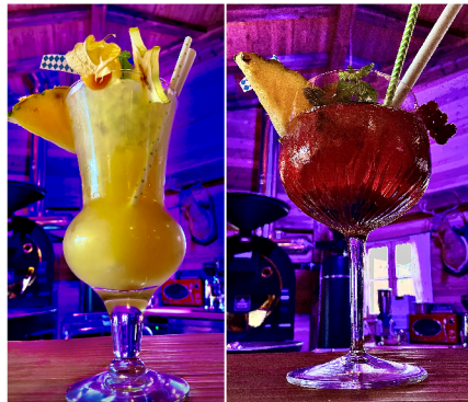
Big Emma Cocktail