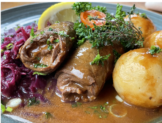
Roulades with red cabbage and dumplings

Panierte Hähnchenbrustfilets, Sour Cream, Farmers Fries Chicken breast fillets, homemade sour cream, Farmers Fries