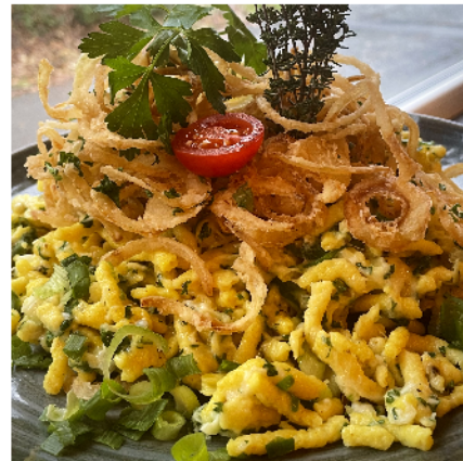
selbst gemachte Käsespätzle