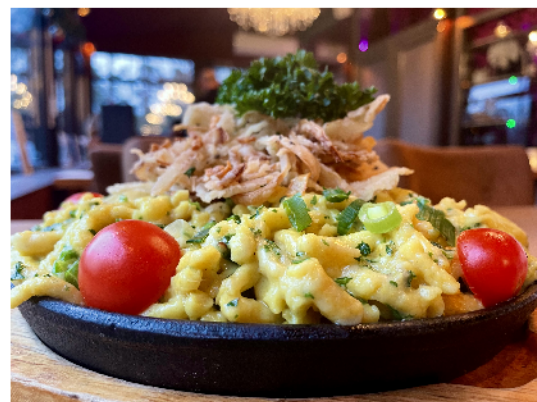
Homemade cheese spaetzle