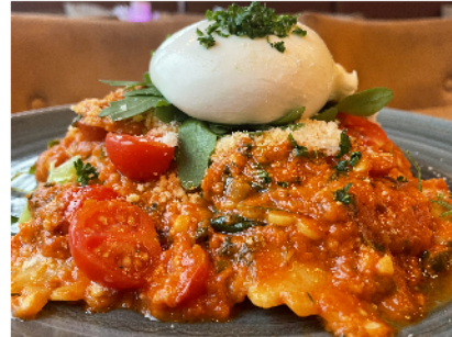
Tomato mozzarella burrata