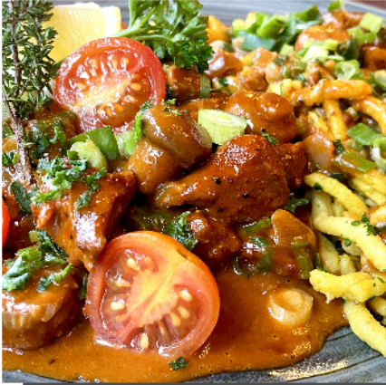
Gulasch mit selbst gemachten Spätzle