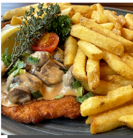
Schnitzel Wiener Art mit Pommes