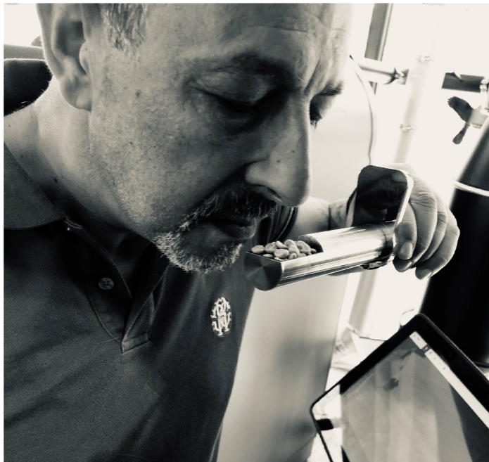
Röstmeister - Peppino

Lassen Sie sich von unserem außergewöhnlichen und handgemachten Kaffee verwöhnen. Der hausgemachte Kuchen und die kleinen Snacks runden unser Angebot ab.