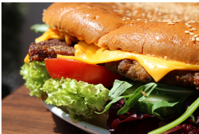
Big Emma Burger

Ein Teilen der Speisen ist leider nicht möglich! Share of the food is not possible!