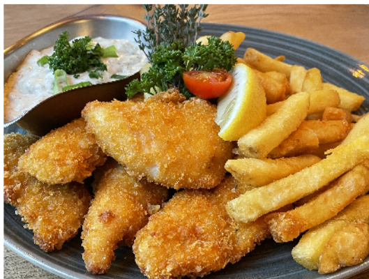
Chicken breast fillets, homemade Sour cream, Farmers Fries