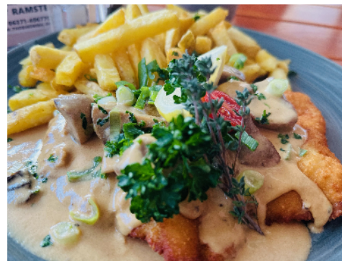
Creamschnitzel with mushrooms